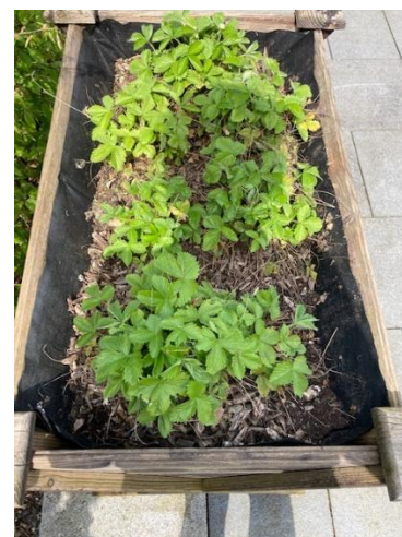
Hier sind Stauden drin, die noch im Verborgenen sind 😊